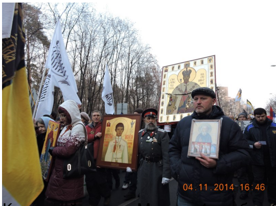
Крестный ход по маршруту от станции метро Октябрьское Поле

Добавил(а) Administrator 04.01.15 20:19 -